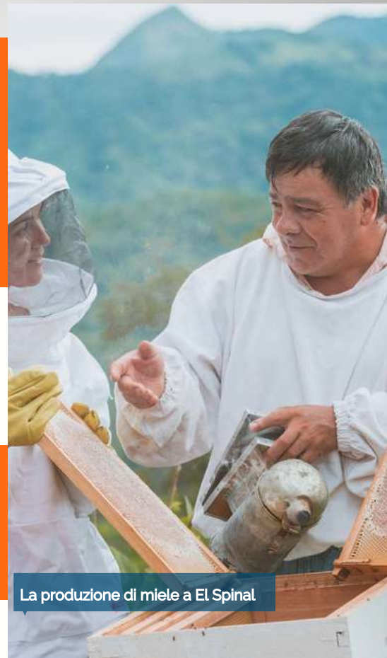
La produzione di miele a El Spinal