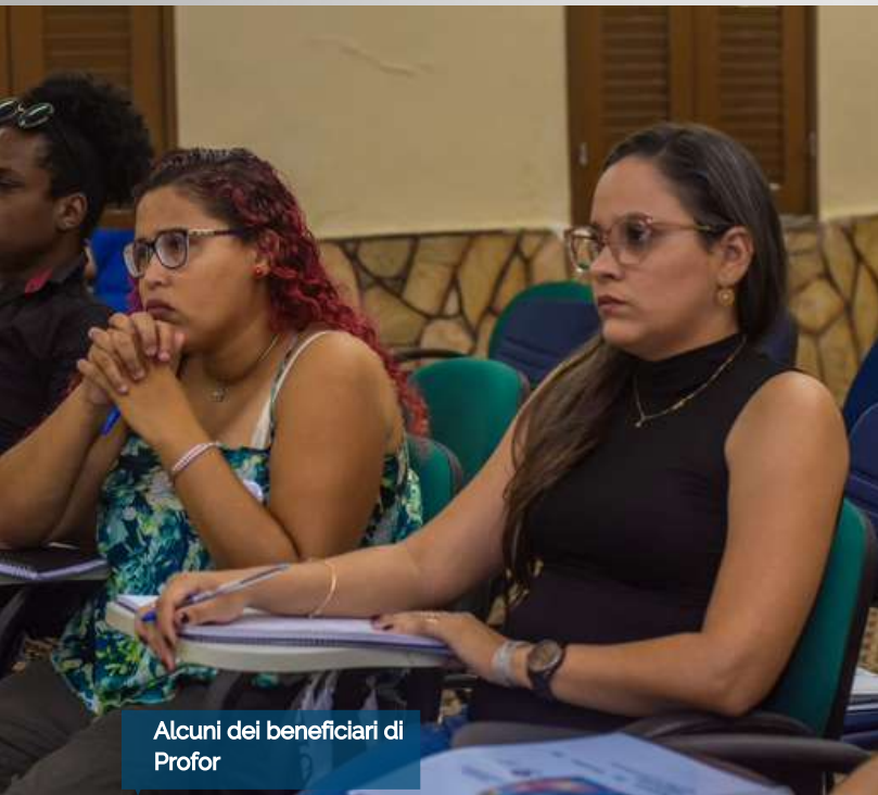
Alcuni dei beneficiari di Profor

5 giovani partecipanti hanno imparato a gestire le loro iniziative attraverso l'elaborazione di un “quadro dimostrativo di risultati” che consente di visualizzare i margini di profitto, i costi fissi e variabili, nonché la necessità di possibili adeguamenti. Imparare a gestire l'approvvigionamento in base alle vendite , ha portato a un aumento della redditività dei progetti durante l'accompagnamento (dicembre-febbraio) così calcolato: