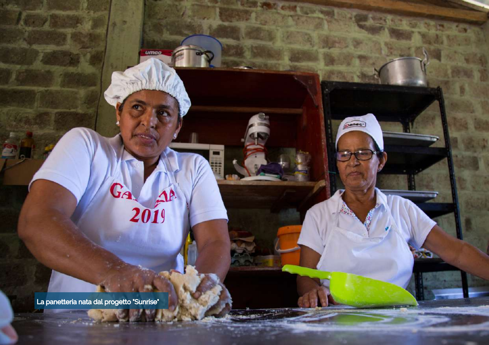
La panetteria nata dal progetto 'Sunrise'