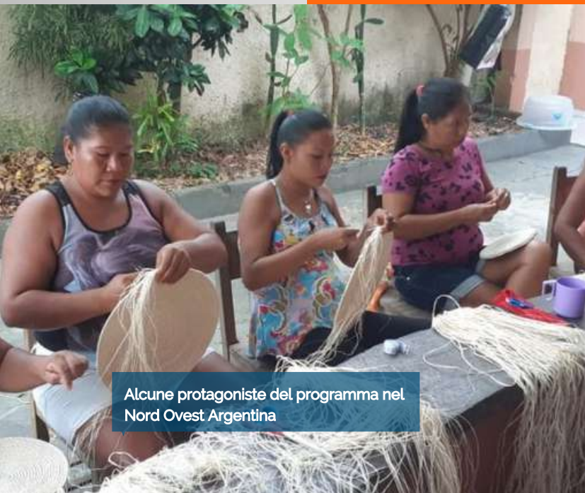
Alcune protagoniste del programma nel Nord Ovest Argentina

(Brealito – “Corso di informatica”; Yariguarenda- “Gastronomia esperienziale”; Salta – “Patrimonio culturale”; Turu Yaco – “Il cammino degli Inca”)