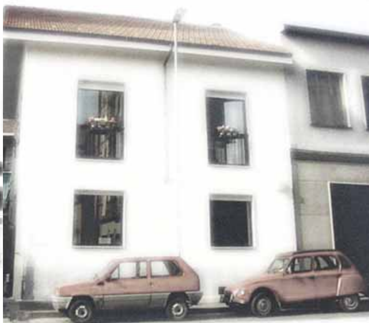
La sede della Ridix nel 1969, nel 1986 e quella attuale.

presentarlo sul mercato italiano. Fino ad allora avevamo sempre considerato i lubrificanti dei prodotti secondari, abituati, come eravamo, a trattare essenzialmente meccanica di alta precisione. Non fu facile: si trattava di un marchio ancora poco conosciuto e, come se non bastasse, costava più del doppio dei suoi concorrenti. Cominciammo in seguito a conoscerlo meglio e a toccare con mano i vantaggi che portava; attraverso nuove vie di vendita e una rete di venditori riuscimmo a penetrare sempre di più il mercato italiano e oggi i lubrificanti della Blaser sono diventati il principale prodotto che trattiamo”.